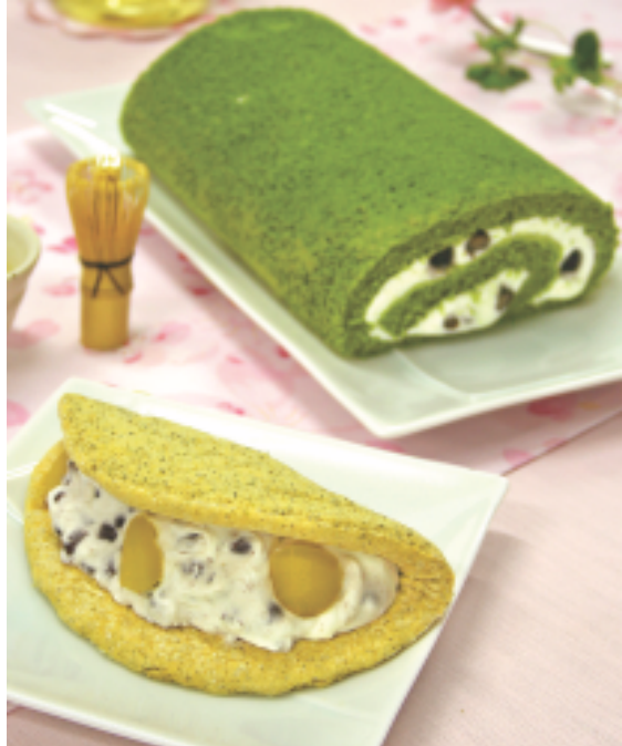
贈り物やお土産にぴったりな御当地ロール「大手町ロール」。きな粉と小倉のオムレットは気軽に食べるおやつにおすすめ。

市民プラザ1F前庭 11:00~18:00 火曜・第2日曜定休 TEL.076-493-0488